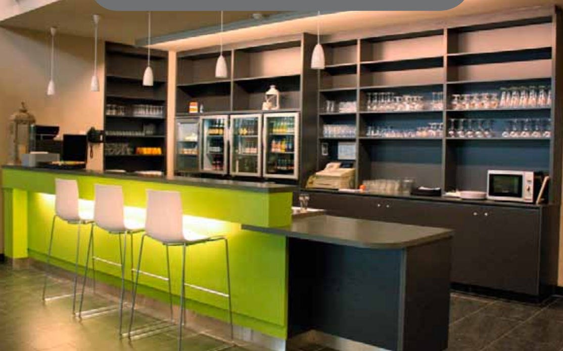
Gezellige cafetaria voor bewoners en bezoekers