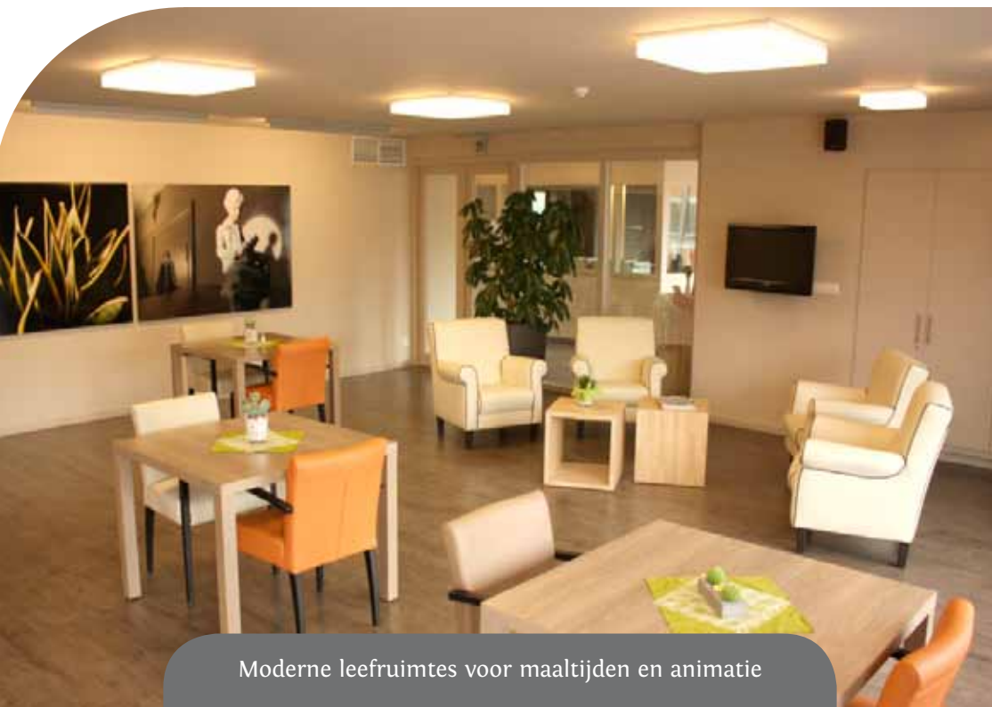
Moderne leefruimtes voor maaltijden en animatie