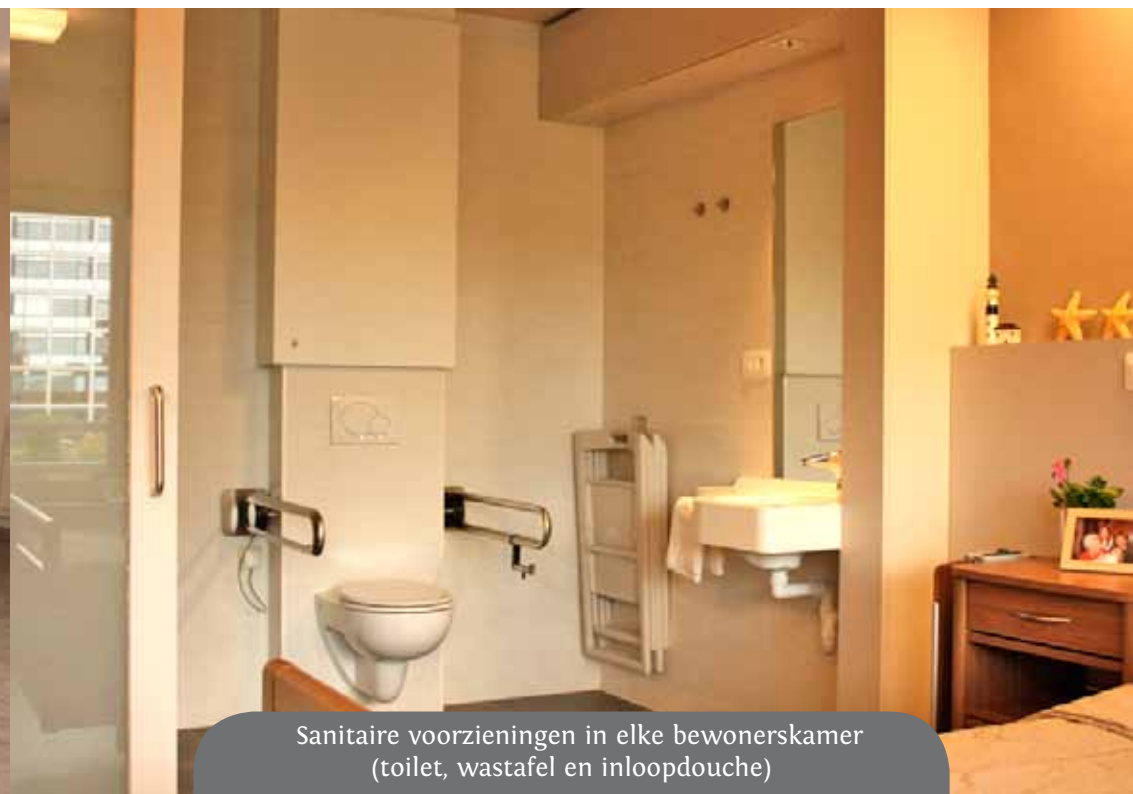
Sanitaire voorzieningen in elke bewonerskamer (toilet, wastafel en inloopdouche)