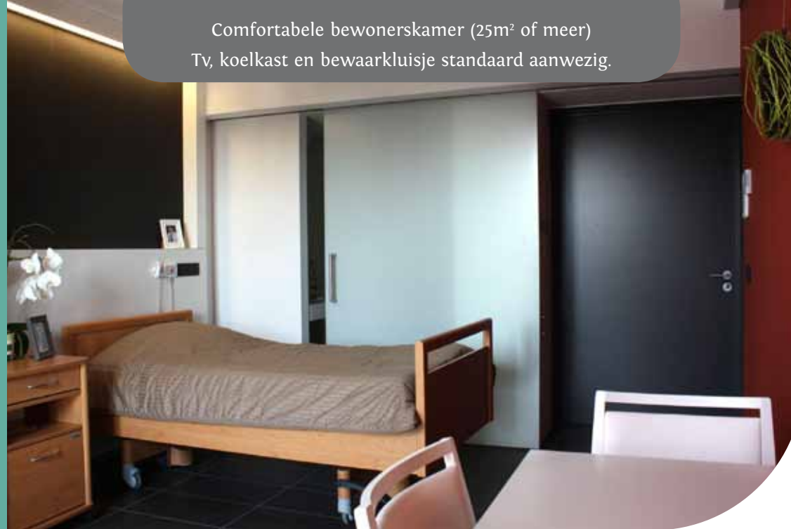
Comfortabele bewonerskamer (25m 2 of meer) Tv, koelkast en bewaarkluisje standaard aanwezig.

De dagprijs voor een bewonerskamer bedraagt 42 euro. Inbegrepen zijn: verzorging, dagelijkse maaltijden, incontinentiemateriaal, onderhoud van de kamer en van het linnen, gebruik tv-toestel en koelkast.